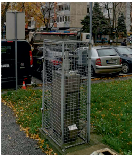
Слика 2. Мерно место за суспендоване ПМ10 честице тим што је то смањење у односу на претходну годину. Максимална измерена вредност суспендованих честица ПМ10 у

За 2022. годину прописана дневна толерантна вредност једнака је дневној граничној вредности и износи 50 \mu\text{g}/\text{m}^3 . У току 2022. године 112 дана, измерене вредности су прелазиле дозвољену дневну граничну и толерантну вредност. У прва четири месеца 2023. године, 44 дана је концентрација ових честица била већа од дозвољене, с