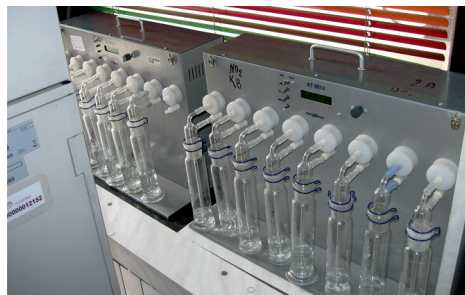
Слика 1. Мерно место за сумпорне и азотне оксиде – Пљакин шанац