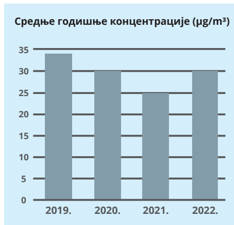
Слика 5. Графички приказ средњих годишњих концентрација ПМ 2.5 честица

\mu\text{g}/\text{m}^3 , као ни толерантна вредност арсена из фракције суспендованих честица ПМ10, која износи 6 \mu\text{g}/\text{m}^3 , такође у току 2022. године, није прекорачена ни једног дана .