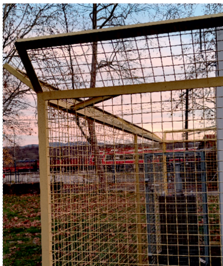
Слика 4. Мерно место за ПМ 2.5 честице – железничка станица вредности.

У табели 4. приказани су подаци везани за ПМ2.5 честице у задње три године. Просечни индикатор изложености суспендованим честицама ПМ 2.5 изражен у µg/m 3 (АЕИ) за 2022. годину утврђен је као просек концентрација за три узастопне године (2020, 2021 и 2022) и израчунат на мерном месту Железничка станица износи 28,17 µg/m 3 што је изнад препоручене